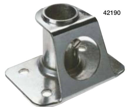
Square deckplate – Ausführung