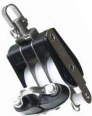
Dreifachblock mit Wirbel, Unterbügel und Klemme | triple with swivel, becket and cleat