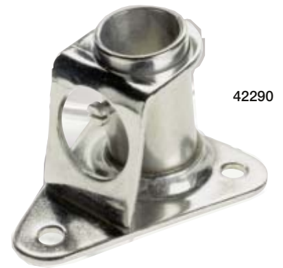
Tri-angle – Ausführung