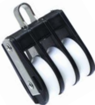
Dreifachblock mit Bügel | triple with bow