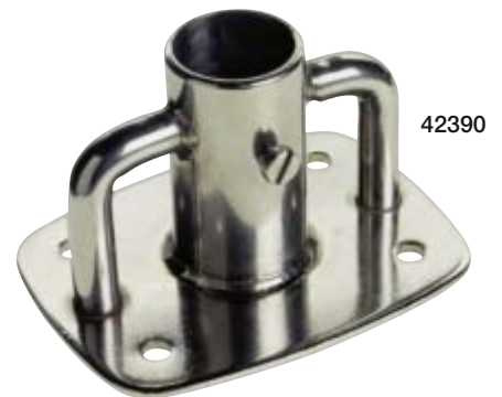
Square deckplate double baled – Ausführung