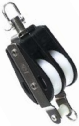
Doppelblöcke Standard mit Wirbel und Untebügel | double with swivel and becket