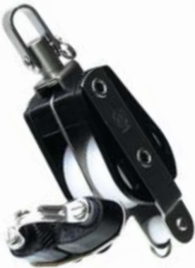
Doppelblöcke mit Wirbel, Unterbügel und Klemme | double with swivel, becket and cleat